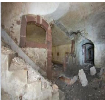
Rendu 3D des couloirs