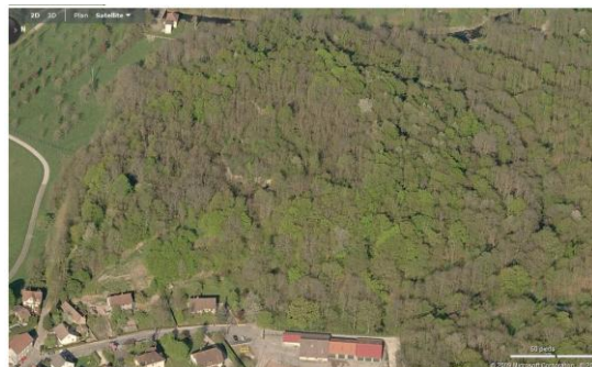
Vue 3D comparée à la vision aérienne actuelle